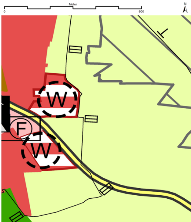
Fläche für die Landwirtschaft