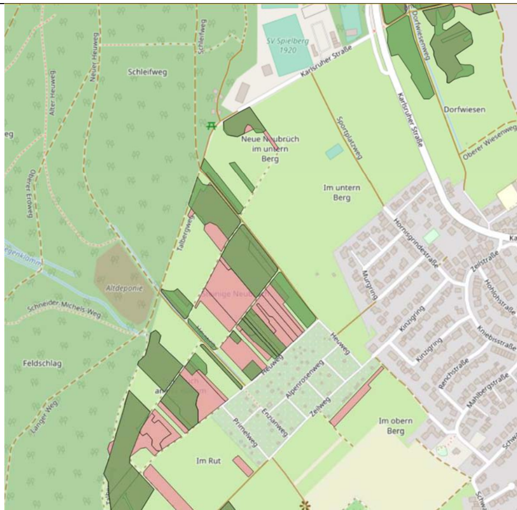
Abbildung 2: Screenshot: FFH-Mähwiesen (grün) und FFH-Mähwiesen-Verlustflächen ausweislich Grünlandkartierung im Regierungsbezirk Karlsruhe (rot) – Kartengrundlage OpenStreetMap

G:\Stp\A#\_Daten\Bereich GS\Generalplanung\Verbandsversammlung\Vorlagen + Anlagen + Sprechzettel\2023\2023-05\Anlagen\Anlage TOP 4_KB-5-E001_Am Talberg_Tab frühzeitig.docx