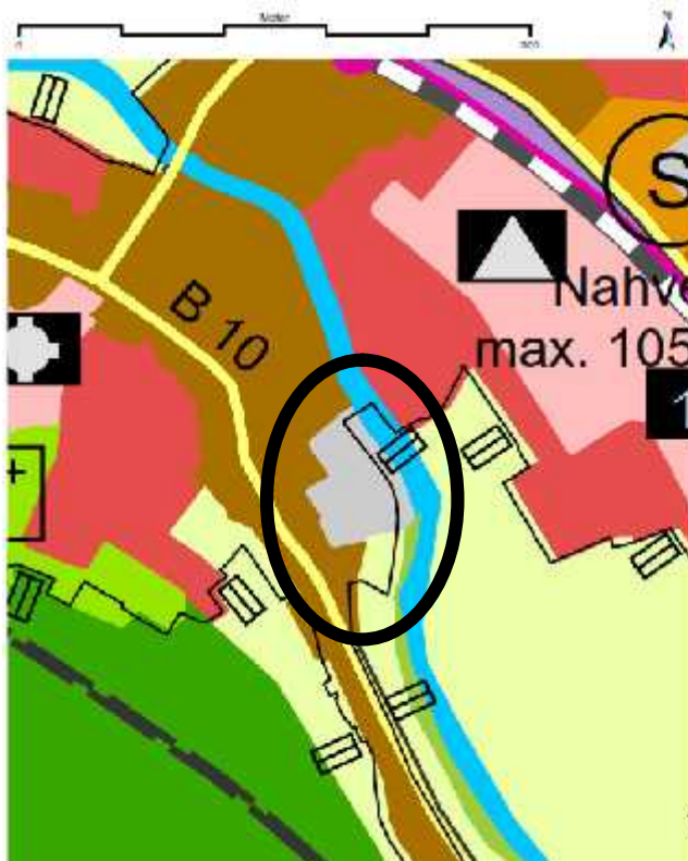
Derzeit geltende Nutzungsdarstellung im FNP

PF-106 Gewerbliche Baufläche und Gemischte Baufläche